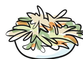
coleslaw cavolo bianco, carote, erba cipollina, maionese