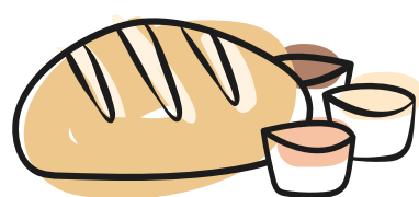
cestino di pane con tre salse vegan homemade