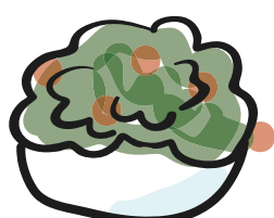
spinaci al burro con grana padano e cranberry