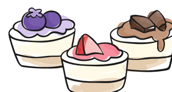
3 bite desserts

Allergie o intolleranze: (1) Cereali contenenti glutine (grano, farro, grano khorasan, segale, orzo, avena), (2) Crostacei, (3) Uova, (4) Pesce, (5) Arachidi, (6) Soia, (7) Latte e prodotti a base di latte (incluso lattosio), (8) frutta a guscio (mandorle, nocciole, noci, noci di acagiù, noci pecan, noci del Brasile, pistacchi, noci macadamia o noci del Queensland), (9) Sedano, (10) Senape, (11) Semi di sesamo, (12) Anidride solforosa e solfiti (se in concentrazioni superiori a 10 mg/kg o 10 mg/litro), (13) Lupini, (14) Molluschi. Per allergie, intolleranze o patologie alimentari, o per qualsiasi dubbio o necessità, si prega di fare riferimento al responsabile di punto vendita. I piatti contrassegnati con (*) sono preparati con materia prima congelata o surgelata all'origine.