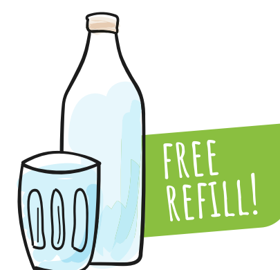
acqua naturale o frizzante