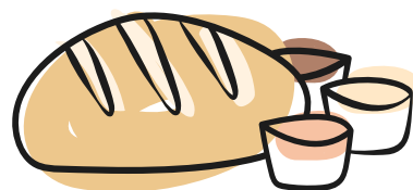
cestino di pane con tre salse vegan homemade