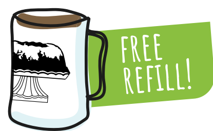
caffé americano o thé caldo