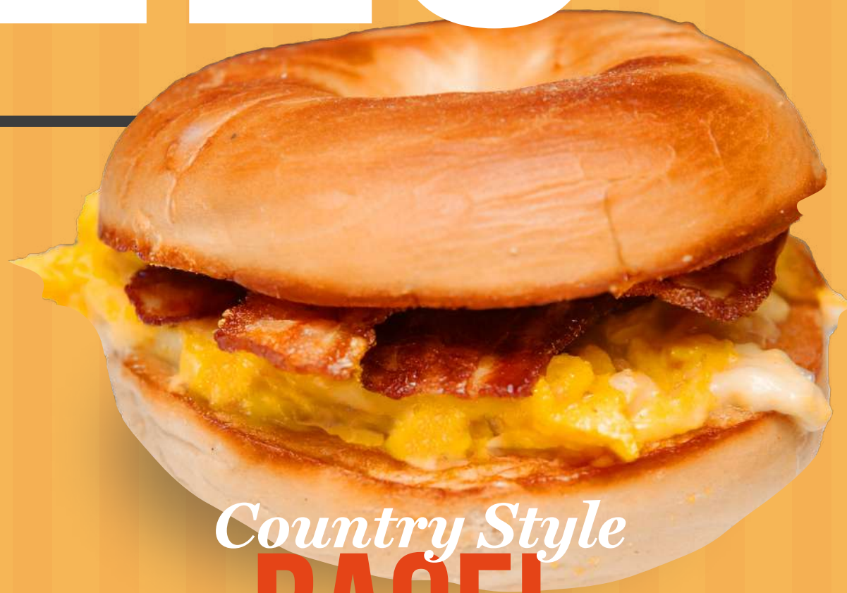
Country Style BAGEL Eggs & Bacon