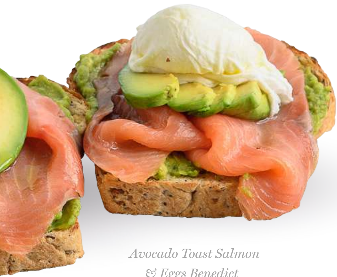
Avocado Toast Salmon & Eggs Benedict

Salmone affumicato*, cream cheese, pomodoro, capperi sott'aceto