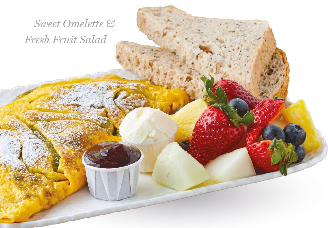
Sweet Omelette & Fresh Fruit Salad