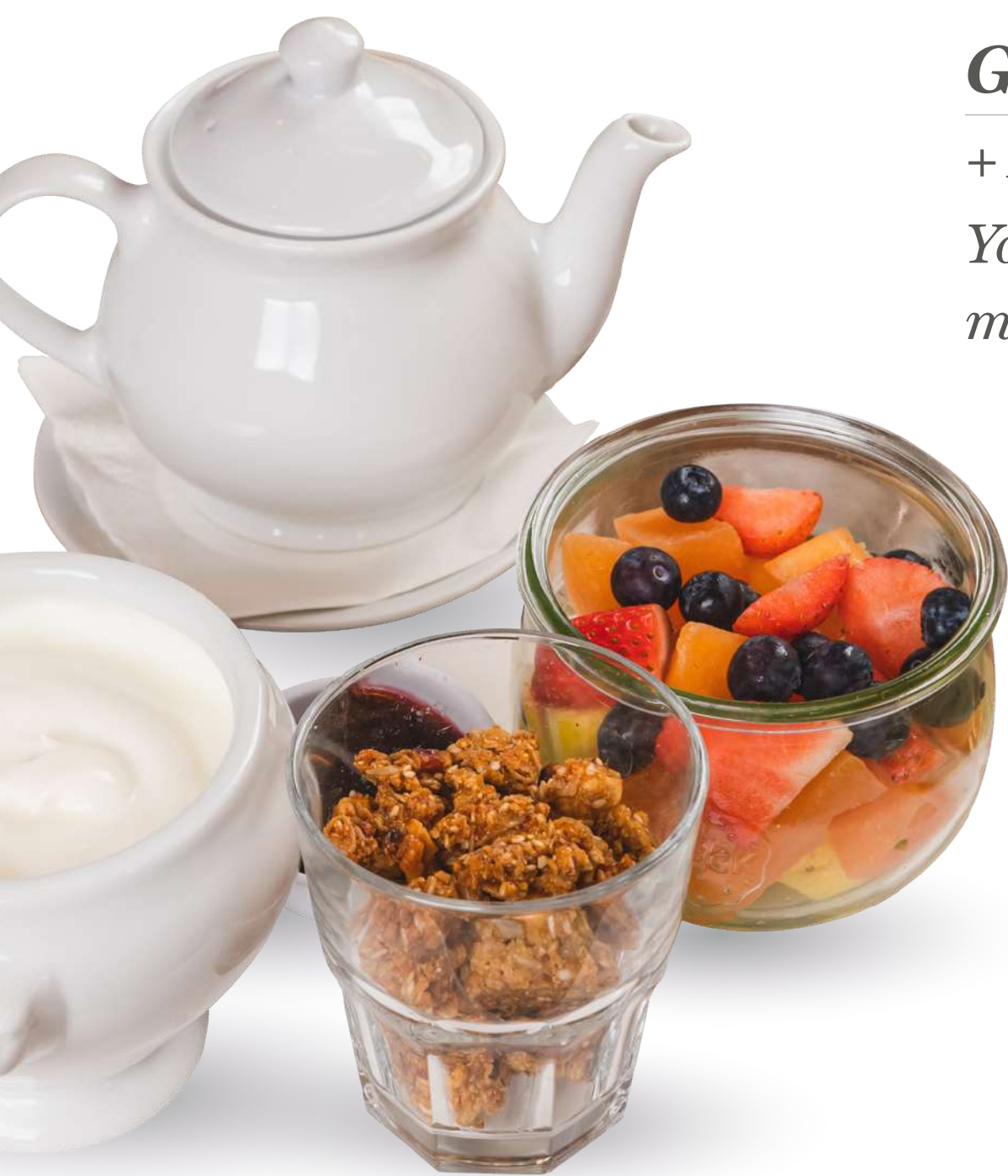
Granola & Yogurt + Fresh Fruit Salad