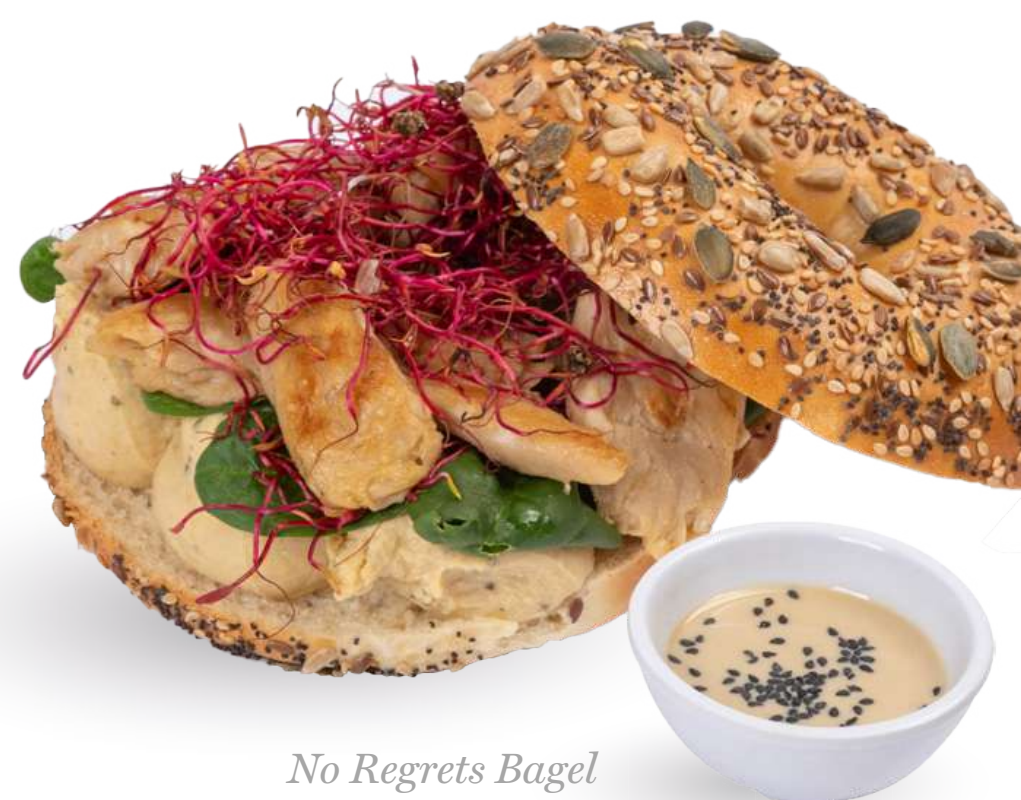
No Regrets Bagel

Bagel multigrain* (1)(11) , plant-based chicken*, hummus di ceci*, spinacino baby, germogli