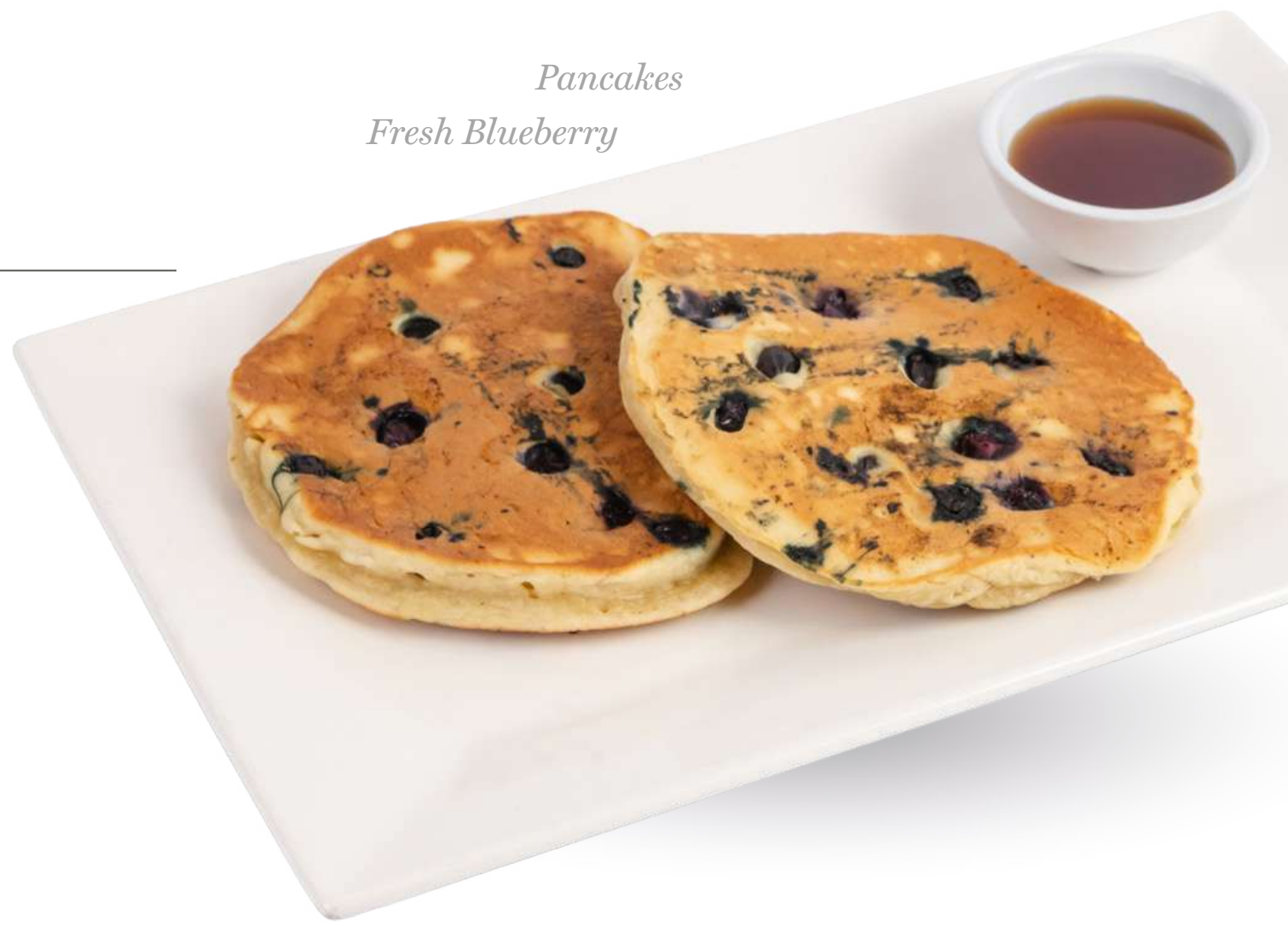
Pancakes Fresh Blueberry