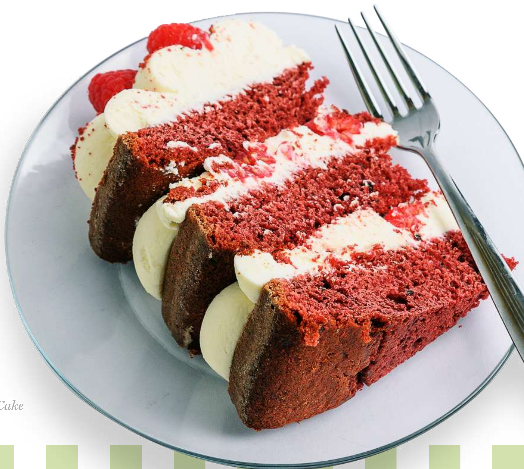
Red Velvet Cake

Torta di carote e ananas* freschi con cocco rapé, noci pecan, spezie e frosting leggero