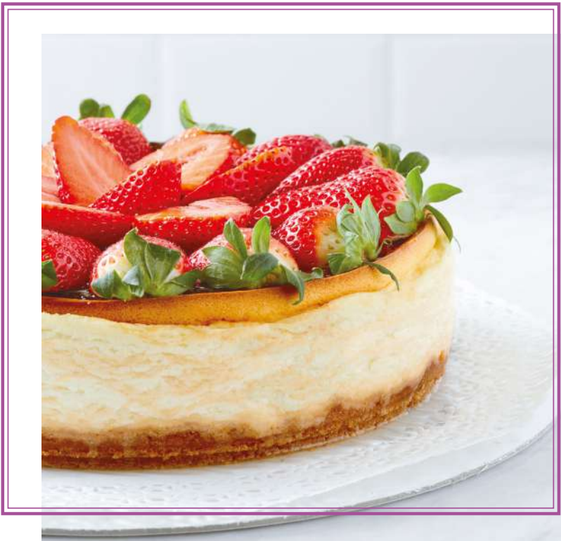
Strawberry NY Cheesecake