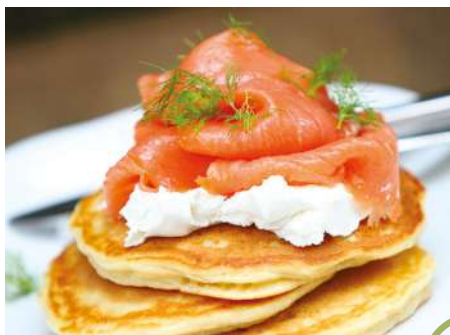
Pancakes Salmon & Cream Cheese