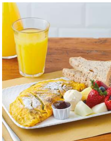
Union Square Sweet