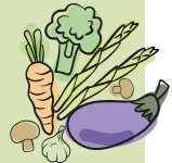
healthies & bowls