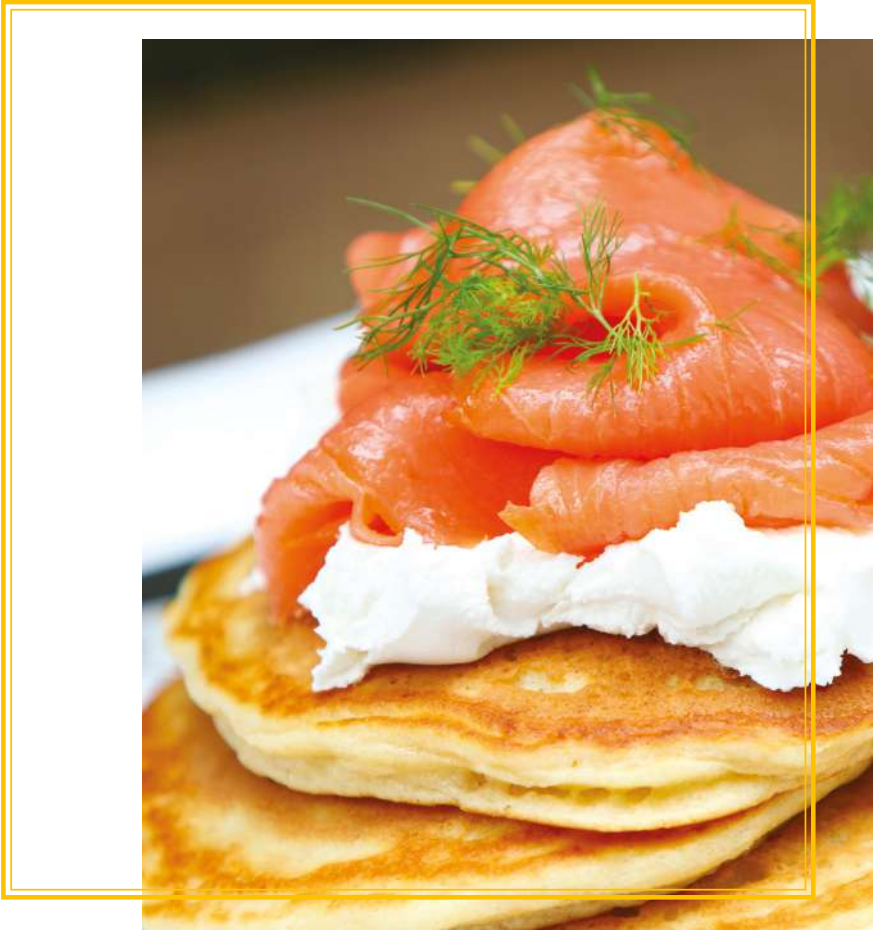
Pancakes Salmon & Cream Cheese