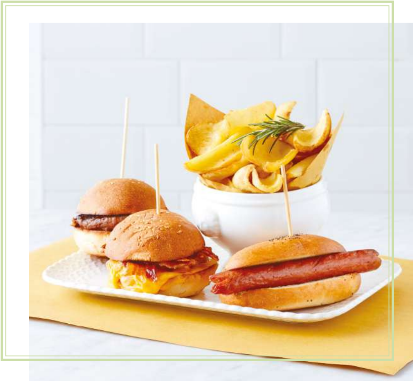
Mini Burgers & Mini Hot dog