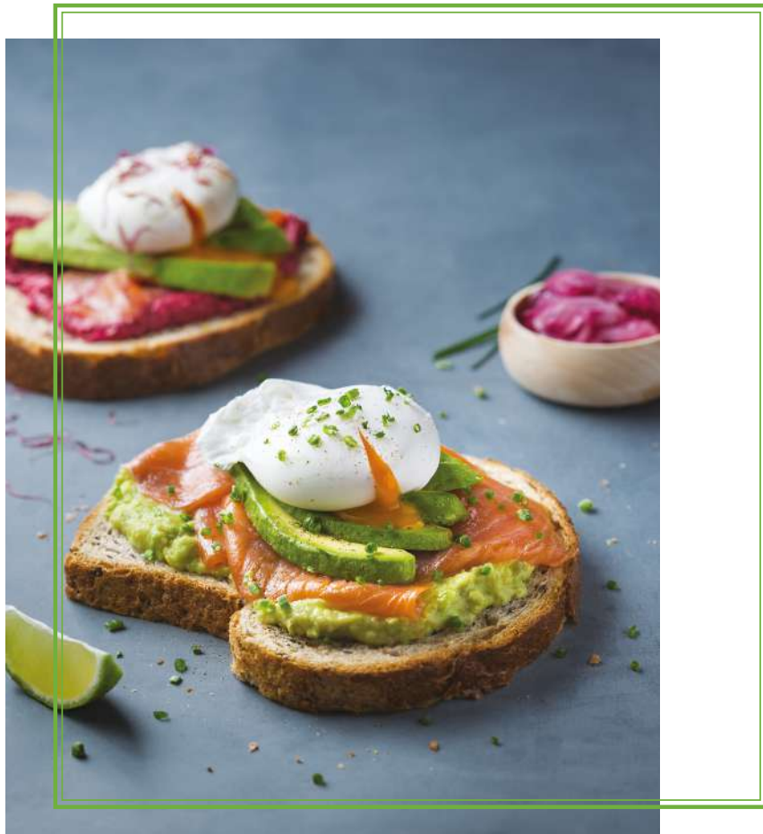
Avocado Toast Salmon & Eggs Benedict