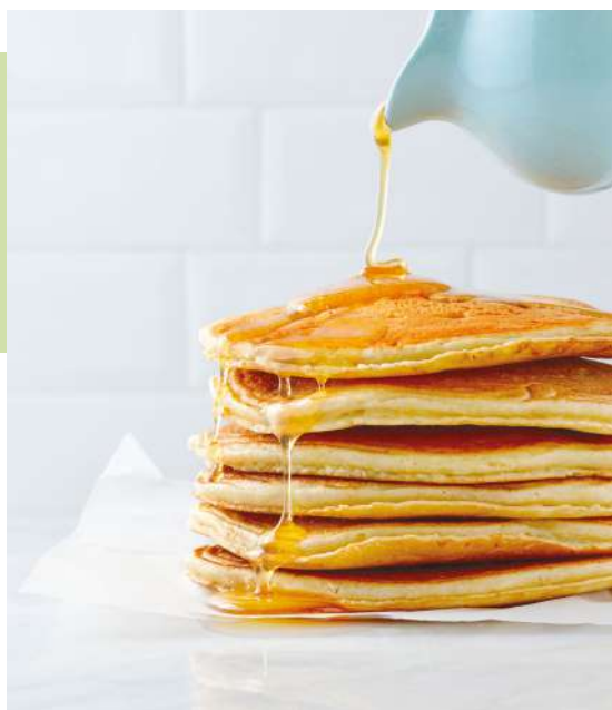
Pancakes con sciroppo d'acero

Nei nostri laboratori lavoriamo in maniera artigianale, prendendoci tutto il tempo che ci serve: il nostro pane è sfornato quotidianamente e lavorato assecondando i tempi di lievitazione, con materie prime di origine naturale, senza l'aggiunta di additivi né conservanti. La nostra è una ricerca paziente, frutto di un lavoro ventennale che ci ha portato a conoscere i migliori prodotti locali e la loro elevata qualità.