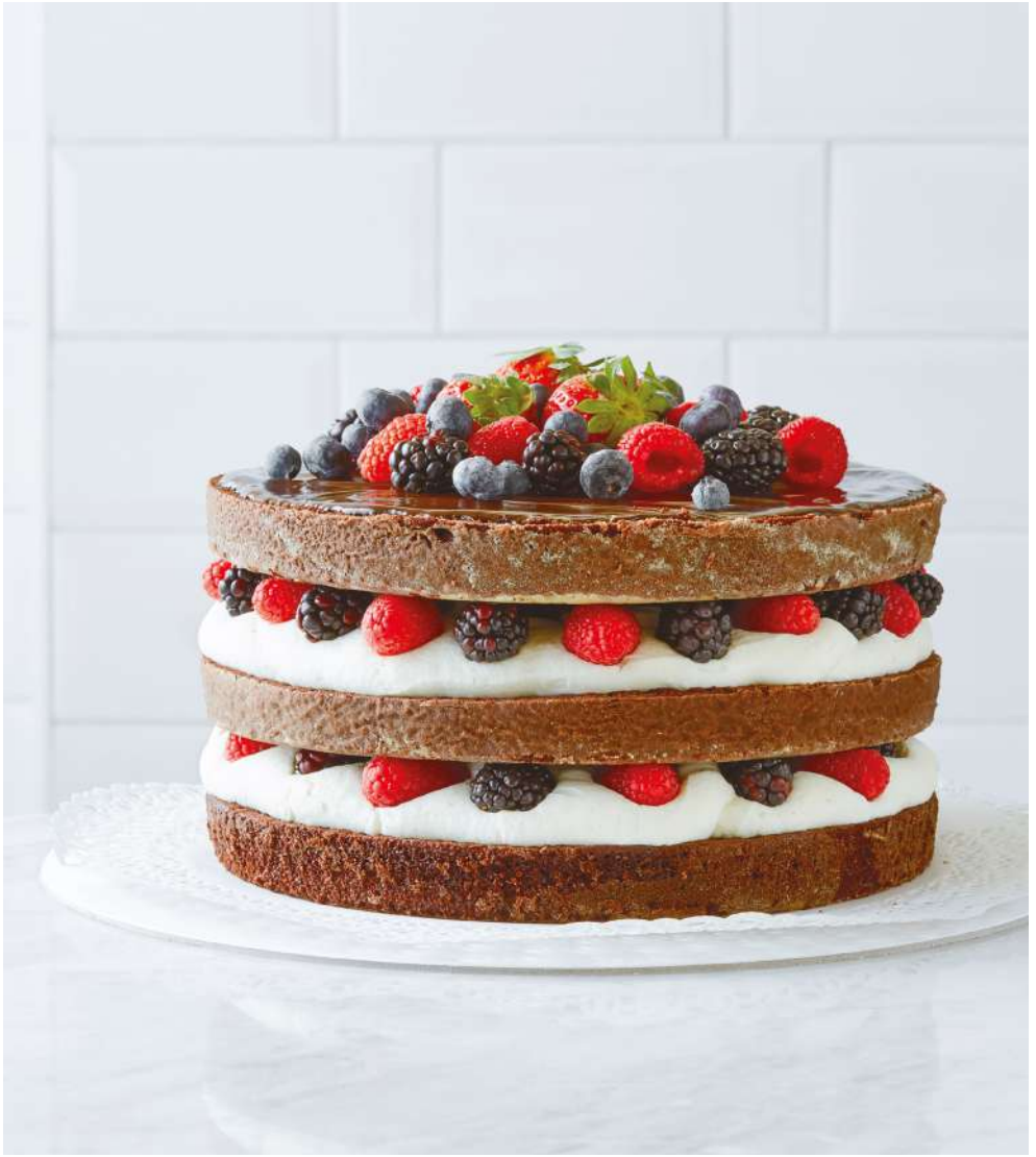
Devil's Food Cake