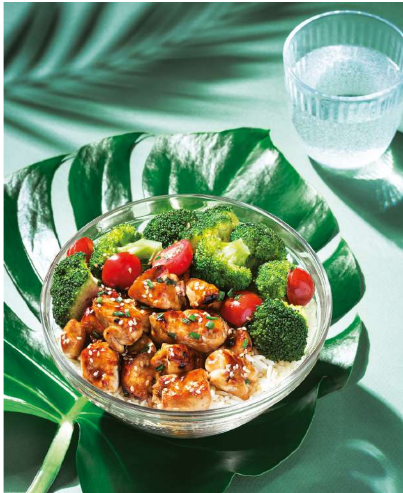
Teriyaki Chicken Bowl