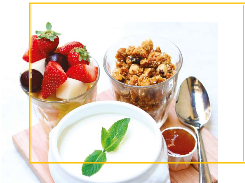
Granola & Yaourt + Salade de fruits frais