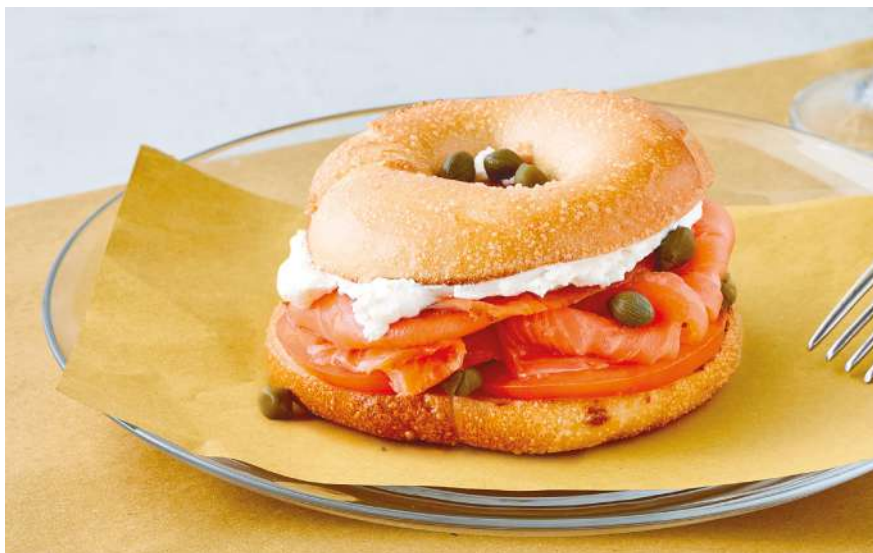
N.Y. Style Bagel

Einfacher Bagel, Sesam-Bagel, Mohn-Bagel