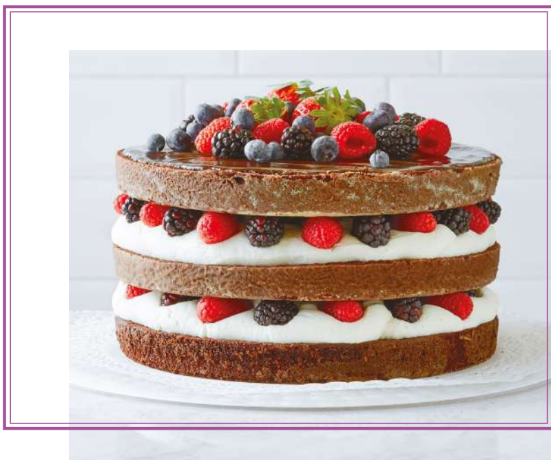
Devil's Food Cake