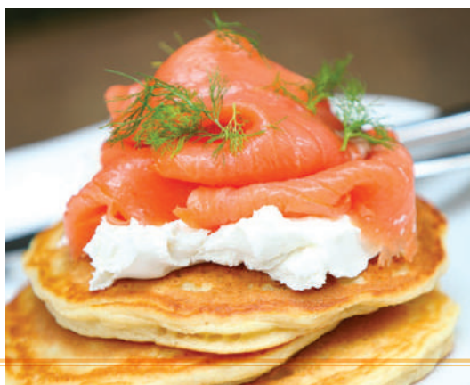
PANCAKES SALMON & CREAM CHEESE

THE BEST PANCAKE TOPPING IS MORE PANCAKES AND... SYRUP!