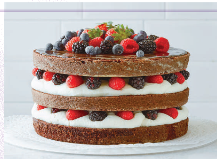
DEVIL'S FOOD CAKE